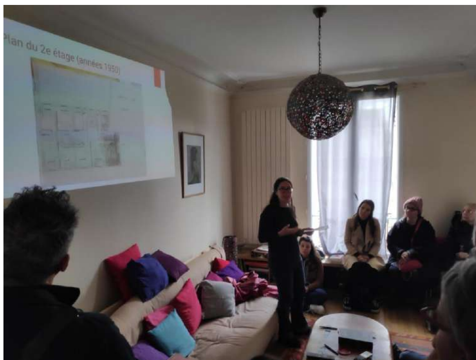
Balade-enquête dans un appartement de la rue du Jambon à Saint-Denis - AMuLoP - 2019

A l'automne 2018 et au printemps 2019, l'AMuLoP a organisé trois balades-enquêtes dans le centre-ville de Saint-Denis, dont l'originalité était de faire entrer les participant.e.s dans des appartements habités pour y découvrir l'histoire des immeubles et de leurs ancien.ne.s habitant.e.s. Ces balades s'appuyaient sur un important travail de recherche mené par l'association dans les archives locales, en quête de traces laissées par les locataires et propriétaires passé.e.s, ou encore par le biais d'entretiens avec les personnes y résidant actuellement.