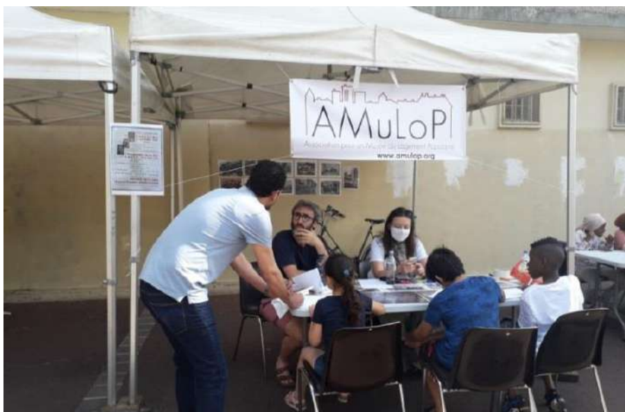
Stand de présentation du projet d'exposition aux habitant.e.s de la Cité Émile-Dubois dite « des 800 » - AMuLoP - 2020