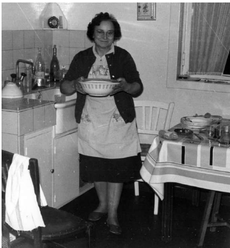
Une cuisine dans un appartement de la cité Langevin, cité de logement social. Photographie de famille. Don privé. – Archives municipales de Saint-Denis – années 1960