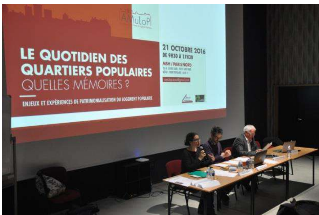
Journée d'études à la Maison des Sciences de l'Homme de Paris Nord à Aubervilliers - AMuLoP - 2016

Entre 2017 et 2019, l'association a proposé un cycle de séminaires dans le cadre des « Ateliers du Campus Condorcet », sur le thème « Entrer dans le logement populaire. Regards croisés sciences sociales, patrimoine et habitants ». Ces séances ont donné lieu à l'intervention d'historien.ne.s, sociologues, archivistes, responsables associatifs et anthropologues. Elles ont porté sur les problématiques de constitution des collections, des enjeux scientifiques et épistémologiques d'une micro-histoire du logement, de la dimension politique de la patrimonialisation de l'habitat, ou encore des enjeux pédagogiques d'une histoire sociale à l'école. Certain.e.s invité.e.s ont permis de développer et d'affiner le projet scientifique et culturel et de nouer de nouveaux partenariats.