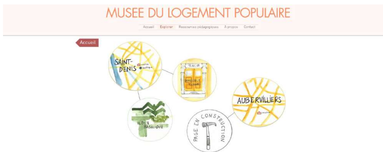
Capture d'écran du site internet pédagogique - Luluffe – AMuLoP - 2020

L'objectif était de rendre compte d'une démarche archivistique et scientifique complexe de façon ludique et pédagogique, permettant de pénétrer à l'intérieur des appartements de façon numérique. Cet outil a été pensé à destination d'un public scolaire du secondaire et comporte un certain nombre de conseils pédagogiques à destination des enseignant.e.s.