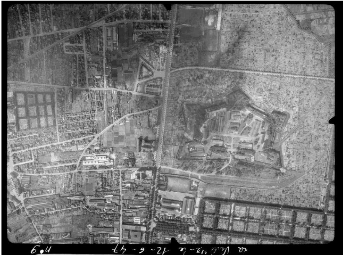
Vue aérienne d'Aubervilliers - 12 juin 1947

La banlieue nord de Paris, reflet de quartiers populaires en mutation