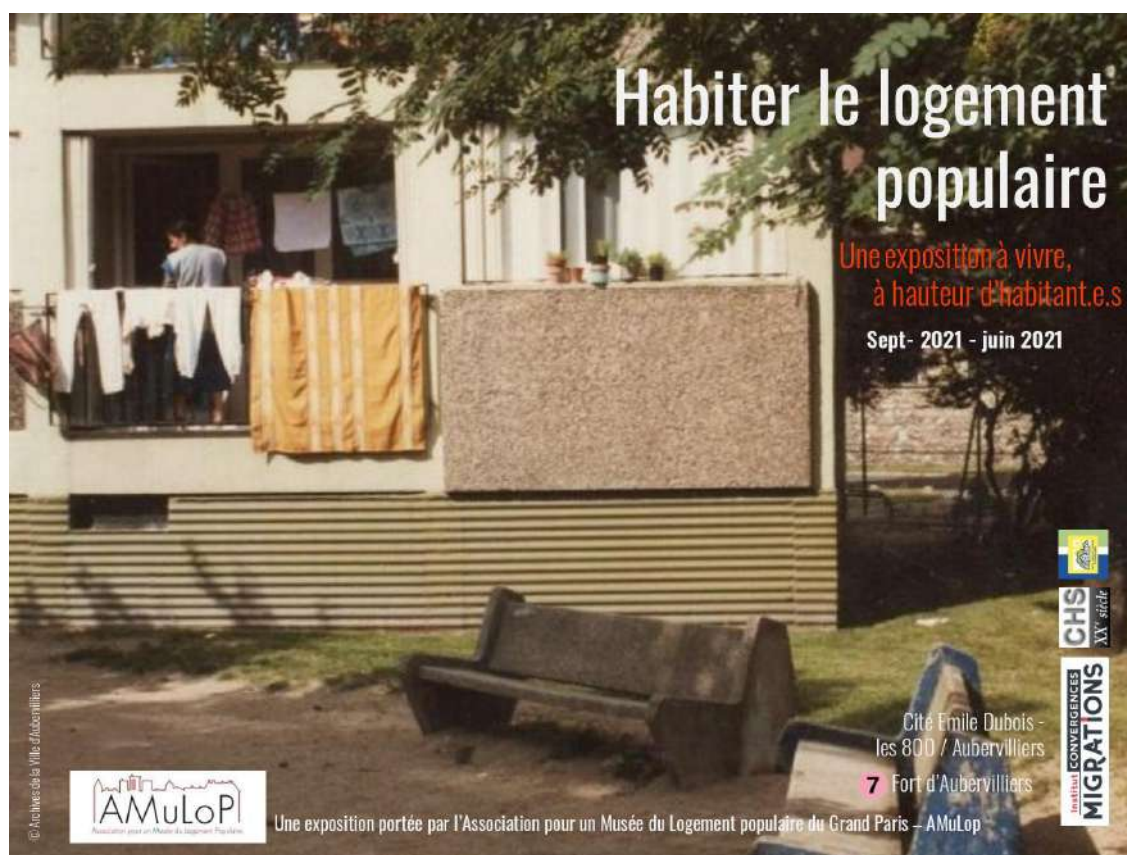
Affiche temporaire de l'exposition – AmuLoP - 2020

Cette exposition se construit en partenariat avec l'Institut Convergences Migrations, le Centre d'histoire sociale des mondes contemporains (CHS), Plaine Commune, la ville d'Aubervilliers, l'OPH et les archives municipales.