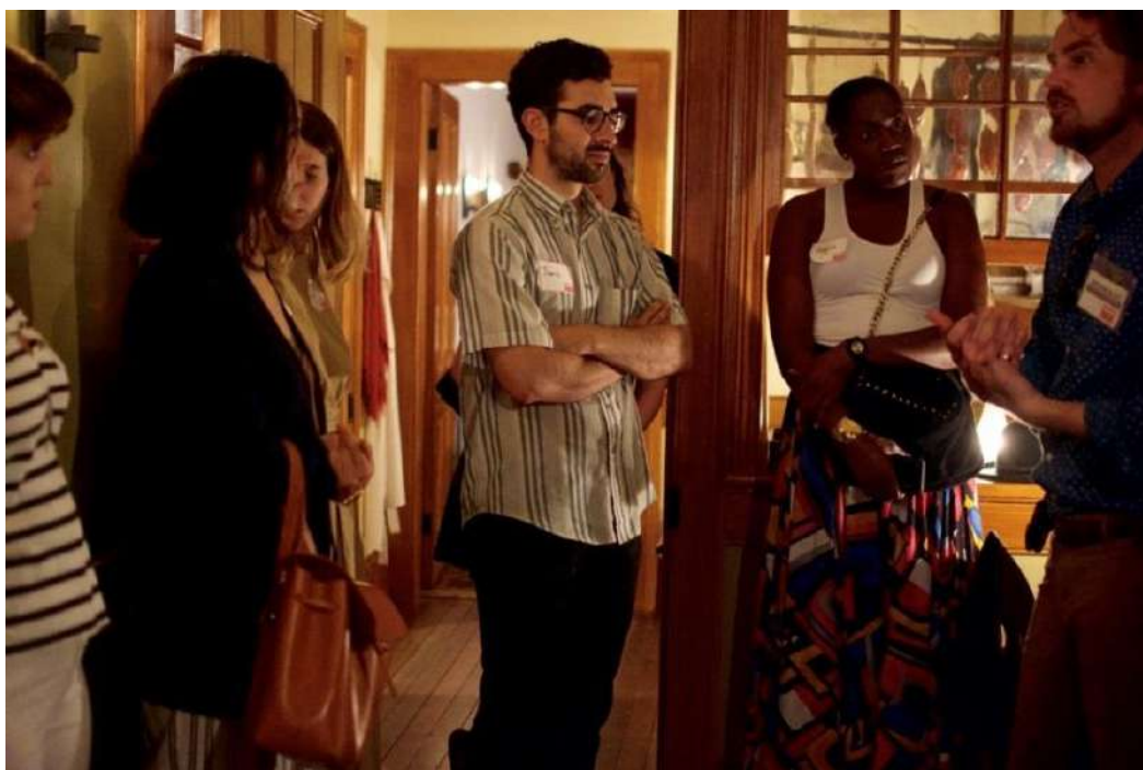
Visite guidée au Tenement Museum - Tenement Museum

Loin de la formule classique de l'exposition, un tel musée entend proposer une expérience d'immersion dans le vécu des ancien.ne.s habitant.e.s des lieux, en alliant la reconstitution des intérieurs à la restitution sensible des vies par le biais d'archives écrites, iconographiques et sonores, comme le propose le Tenement Museum de New York. Un dispositif de médiation porté par des guides conférencier.e.s oriente la visite tout en favorisant une participation active du public. Une des options envisagées est de recruter des guides susceptibles, à la fois, de porter le récit d'itinéraires individuels et familiaux, et d'interpeller le public, en initiant échanges et questionnements sur les enjeux sociaux et urbains du territoire du Grand Paris. Dans le même sens, ce type de visite peut intégrer la performance théâtrale, ainsi que l'usage de supports numériques donnant, par exemple, accès à des documents d'archives, ou encore aux coulisses du musée et à l'élaboration de ses contenus scientifiques.